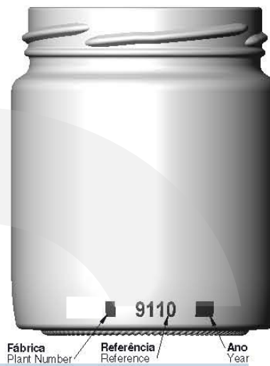
VISTA DE TRÁS BACK VIEW